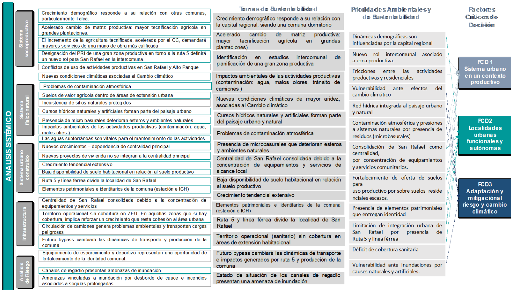
Figura 3 Definición de Factores Críticos de Decisión y Temas Clave